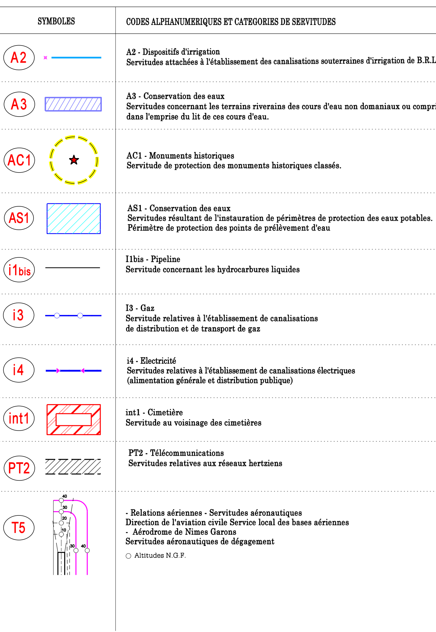
TABLEAU RECAPITULATIF DES SERVITUDES D'UTILITE PUBLIQUE