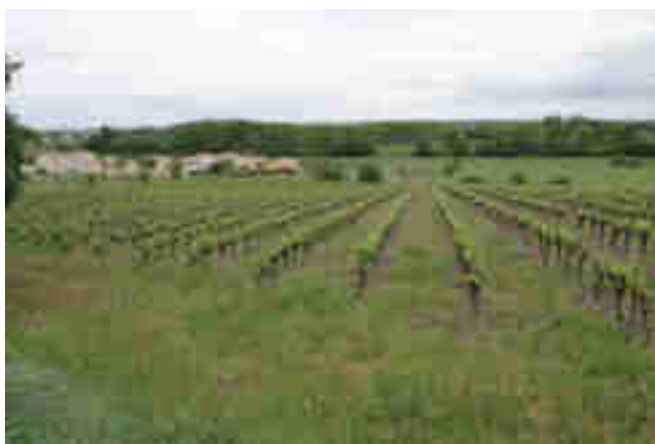
Exemple de vigne enherbée.

De grandes parcelles de vigne sont encore présentes sur le site, la plupart étant cultivées intensivement avec une végétation herbacée au sol quasi nul. Mais certaines parcelles présentent des bandes enherbées, favorables à une certaine diversité florale et par la même faunistique.