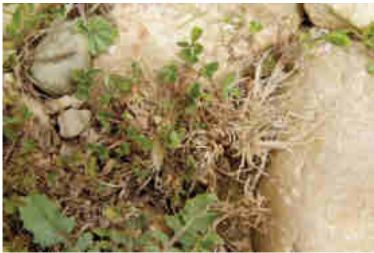
Pieds séchés d'Isoète de Durieux (couleur paille).

Ce petit secteur devra donc être évité de tout aménagement et peut bénéficier de mesures de préservation, voire restauration, valant compensation.