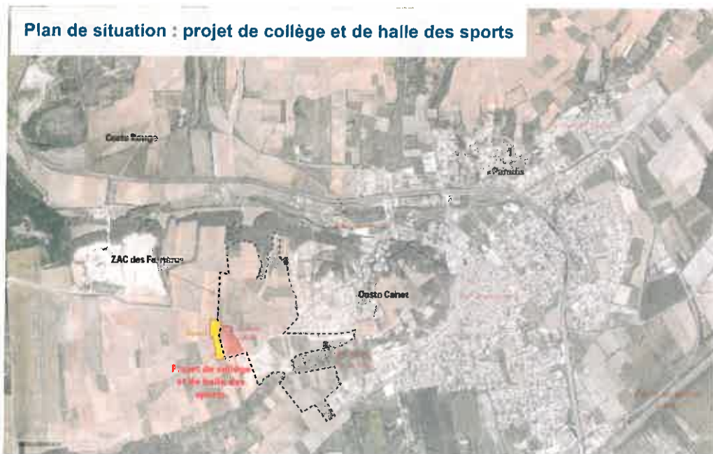
Plan de situation : projet de collège et de halle des sports

Le dossier de l'enquête publique réalisée conformément au chapitre III du titre II du livre Ier du code de l'environnement est complété par une notice présentant la construction ou l'opération d'intérêt général. (...) »