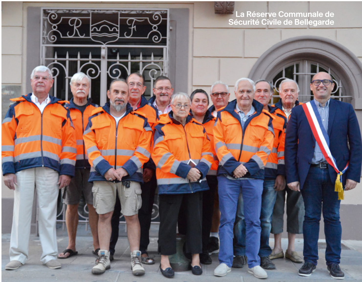
La Réserve Communale de Sécurité Civile de Bellegarde