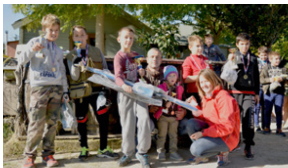
Les gagnants du concours de pêche de la journée des enfants.