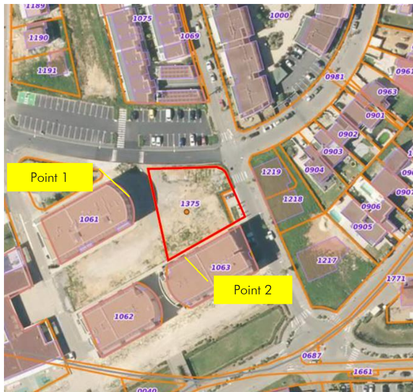
Localisation prévisionnelle du point de mesure

Dans le cadre de la réalisation de mesures d'état sonore initial, il est nécessaire de procéder à un gardiennage des points de mesure (2 points de mesure) pendant une durée de 24h.