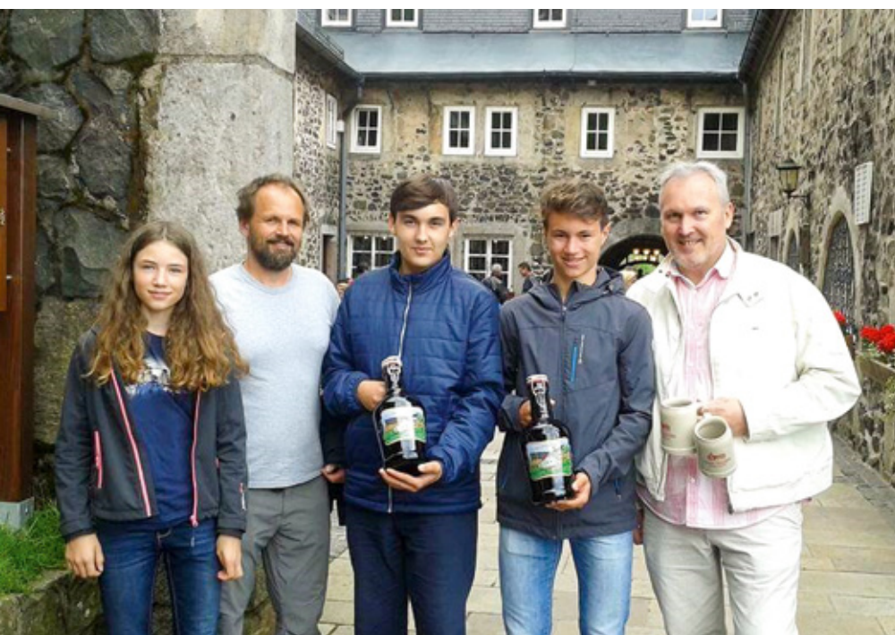
Brasserie du Cloître de Kreuzberg

Deux collégiens bellegardais ont terminé leur année scolaire à la Rhönschule, le collège de Gersfeld. Ils nous rapportent leur expérience au sein des familles qui les ont accueillis et dans l'établissement scolaire qu'ils ont intégré durant leur séjour.